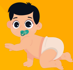
Νεογνά και μωρά