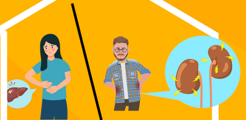
Ασθενείς με νεφρικές ή ηπατικές παθήσεις