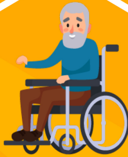
Άτομα με αναπηρίες