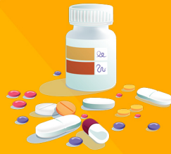
Άτομα που λαμβάνουν συγκεκριμένα φάρμακα