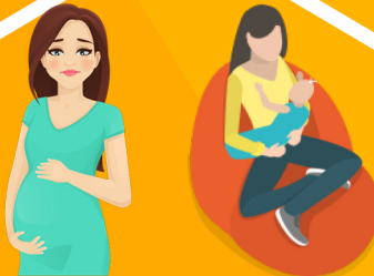
Έγκυες & θηλάζουσες γυναίκες